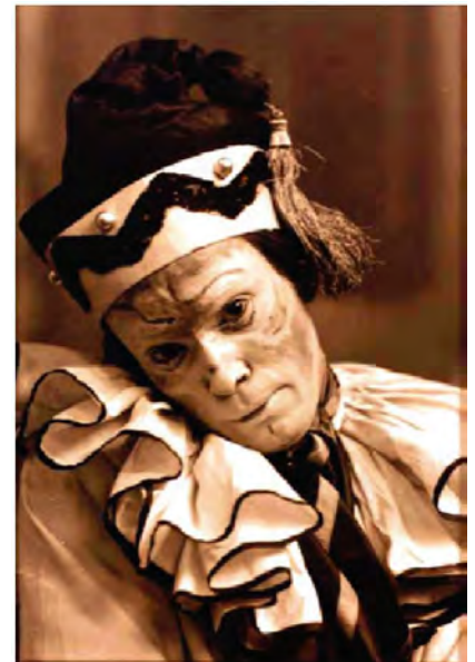
Le danseur créateur de Petrouchka

Une version scénique pour marionnettes - commande du FDL - sera présentée pour ces soirées.